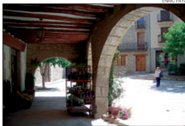
Plaçà porticada de la Llacuna.

A més de disfrutar les impressions panoràmiques des de les restes de l'ermita de Sant Pere de Màger, la festa proporciona un excel·lent pretext per descobrir la plaça Major de la Llacuna, un dels millors recintes porticats de Catalunya, i resseguir els vestigis de les antigues muralles, amb els seus portals, integrats avui en el traçat urbà. Als seus voltants, convé deixar-se